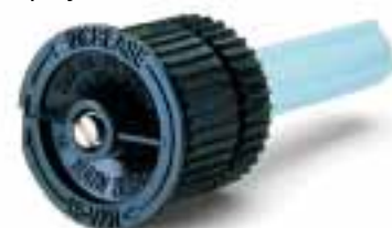
Bocais VAN pré-instalados